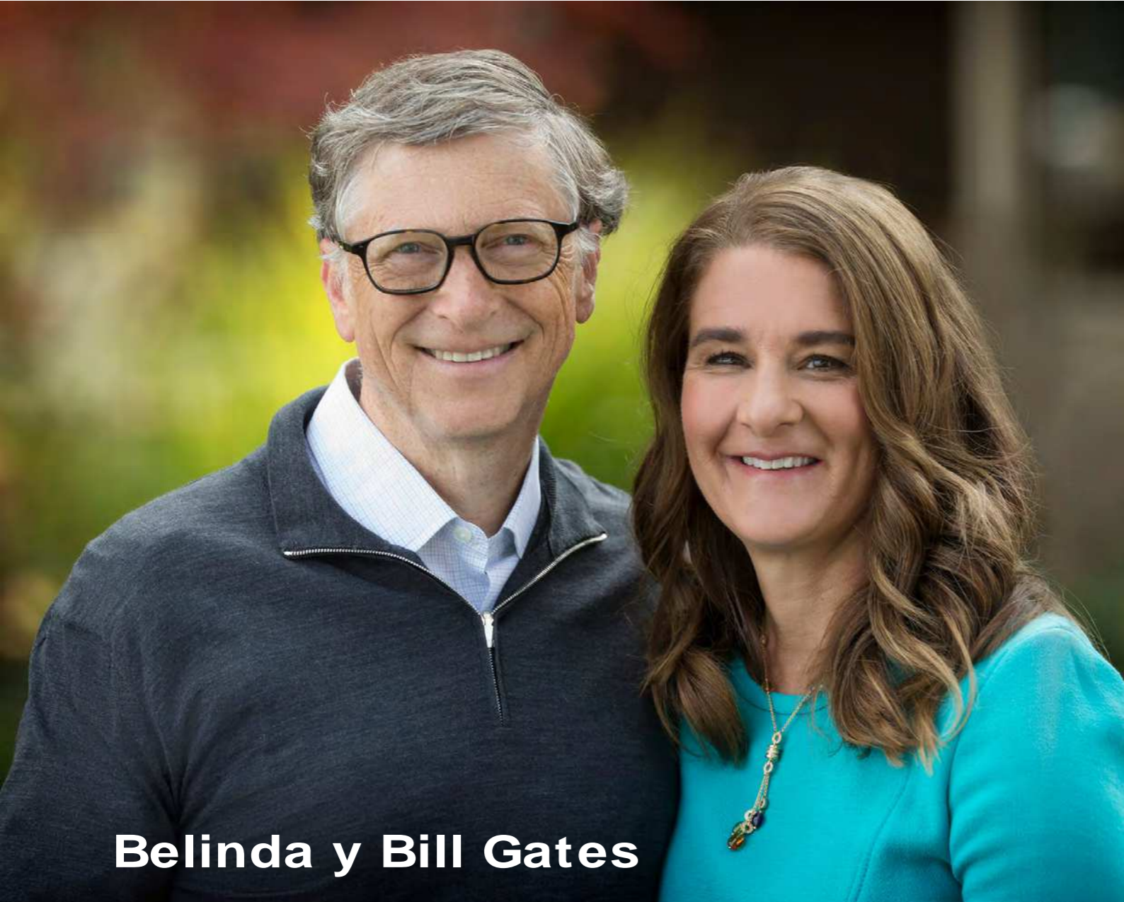
Belinda y Bill Gates