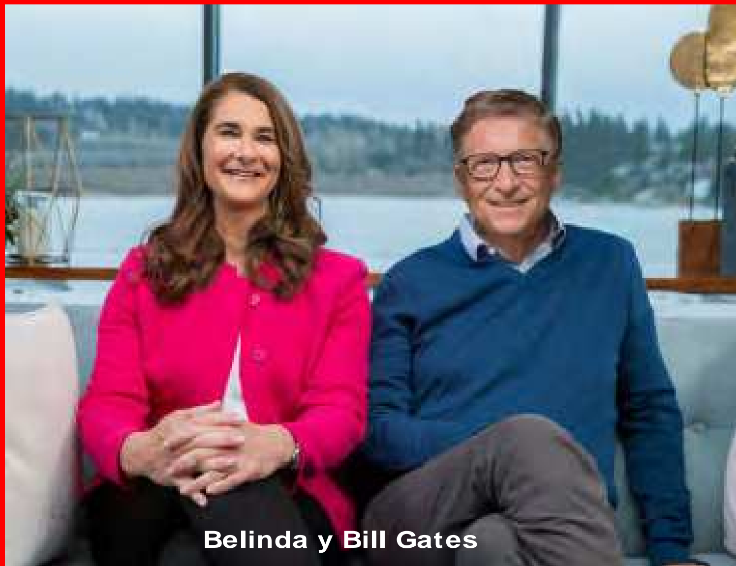
Belinda y Bill Gates

Nuestra carta anual 2019 Por Bill y Melinda Gates