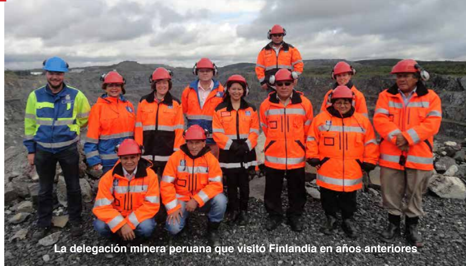
La delegación minera peruana que visitó Finlandia en años anteriores

los proveedores finlandeses de tecnología con el apoyo de la Embajada de Perú en Finlandia y Rumbo Minero, representa una gran oportunidad para conocer de primera fuente lo que hace que hoy, Finlandia, esté destacándose en la minería. Sin ser uno de los mayores productores de minerales o el de mayor potencial geológico, como lo es, el Perú.