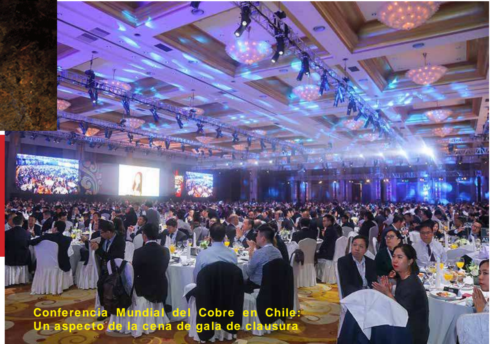
Conferencia Mundial del Cobre en Chile: Un aspecto de la cena de gala de clausura

Esta cumbre de nivel de directores ejecutivos ostenta una impresionante delegación de dirigentes de la industria, y es la mejor oportunidad para escuchar a líderes de la industria minera y de fundición de cobre. La conferencia es conocida por su excelente contenido que combina perspectivas económicas, financieras, técnicas, políticas y sociales, para ofrecer un panorama completo de los desafíos y oportunidades que enfrenta la industria.