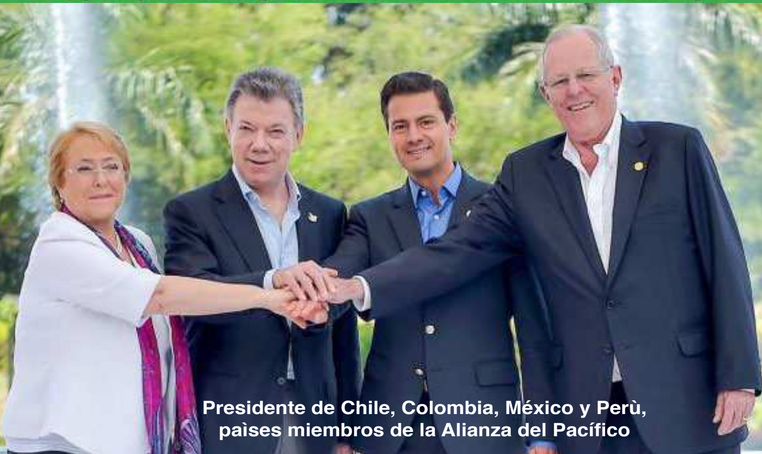
Presidente de Chile, Colombia, México y Perú, países miembros de la Alianza del Pacífico

La Alianza del Pacífico es una Iniciativa de Integración regional conformada por 4 países miembros: Chile, Colombia, México y Perú. La Alianza del Pacífico surgió luego de la Declaración de Lima de 2011, convocada por el presidente Alan García. Busca impulsar el crecimiento, desarrollo y competitividad de las economías del Pacífico y su proyección al mundo, particularmente al Asia Pacífico, que se perfila como eje fundamental de la economía mundial de este siglo.