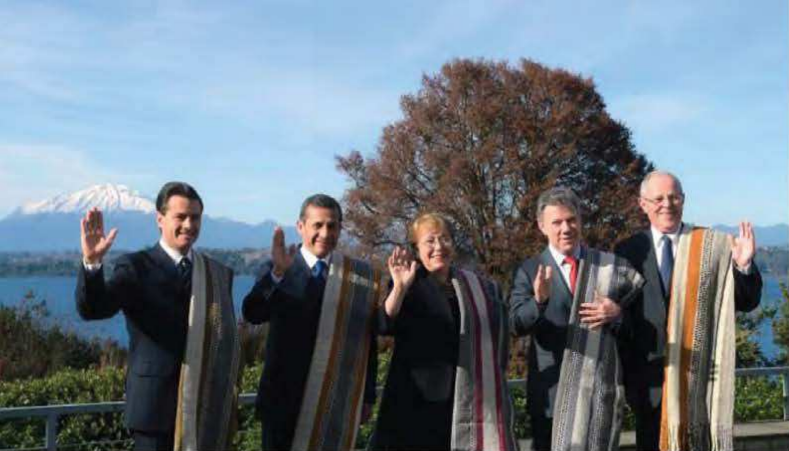
Los presidentes de México, Enrique Peña, de Perú, Ollanta Humala, de Chile, Michelle Bachelet y de Colombia, Juan Manuel Santos en el último encuentro en Chile en julio 2016 con el presidente electo Pedro Pablo Kuczynski quien reemplazó al presidente Humala desde el 28 de julio

fondo inició operaciones con un millón de dólares, en donde cada país aportó 250.000 dólares.